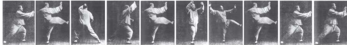
进步撇拦捶 右蹬脚 左打虎式 右打虎式 回身右蹬脚 双风贯耳 左蹬脚 转身右蹬脚 进步撇拦捶 如封似闭