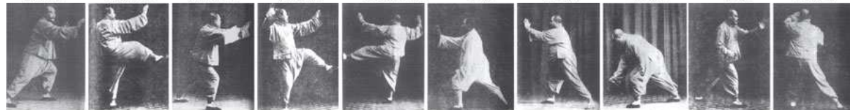
右分脚捋式 右分脚 左分脚捋式 左分脚 转身蹬脚 左接膝拗步 右接膝拗步 进步栽捶 翻身撇身捶1 翻身撇身捶2