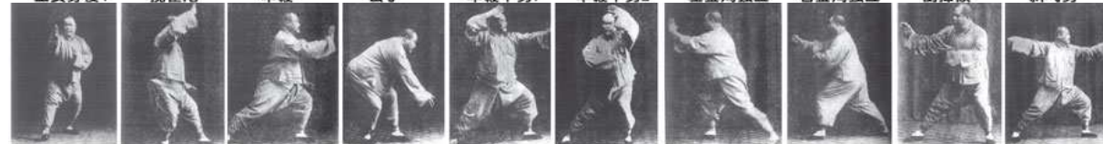
提手上势 白鹤亮翅 左接膝拗步 海底针 扇通背 转身白蛇吐信1 白蛇吐信2 撇拦捶 上步揽雀尾 单鞭