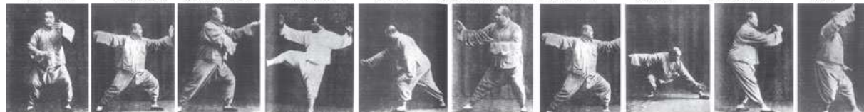
云手 单鞭 高探马穿掌 十字腿 进步指裆捶 上步揽雀尾 单鞭下势1 单鞭下势2 上步七星 退步跨虎