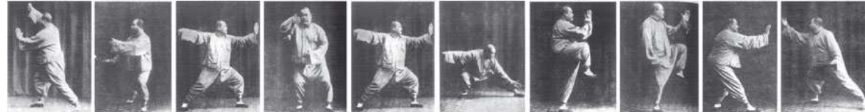
玉女穿梭4 揽雀尾 单鞭 云手 单鞭下势1 单鞭下势2 左金鸡独立 右金鸡独立 倒撵猴 斜飞势