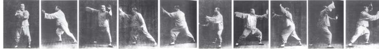
十字手 抱虎归山 斜单鞭 右野马分鬃 左野马分鬃 揽雀尾 单鞭 玉女穿梭1 玉女穿梭2 玉女穿梭3