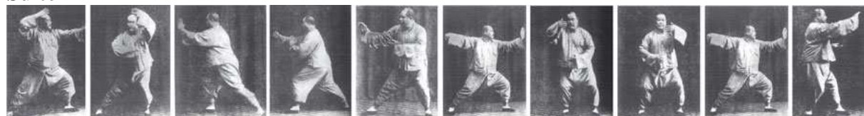
扇通背 撇身捶1 撇身捶2 撇拦捶 上步揽雀尾 单鞭 右云手 左云手 单鞭 高探马